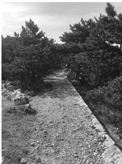
Welches ist mein Weg?